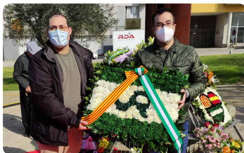
Ofrena floral del dia d'Andalusia.

PSC-En Comú Podem, que va dir que tots els ciutadans reben resposta en el termini establert, cosa que és manifestament FALSA. Tenim un govern que basa la seva acció política en la mentida.