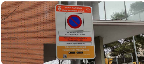
Nova zona taronja.

D'altra banda, el control es farà amb una aplicació mòbil, i les persones que no disposin d'aquesta App no podran aparcar i no tenen alternativa.